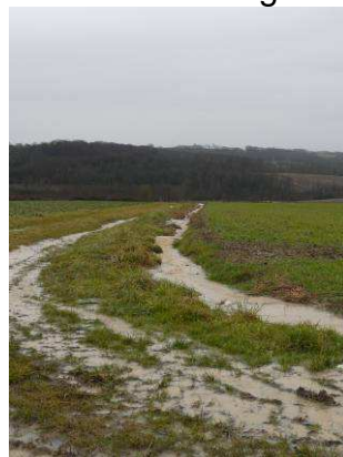
Débordement du Toison en fond de vallée et surverse au niveau de la voirie