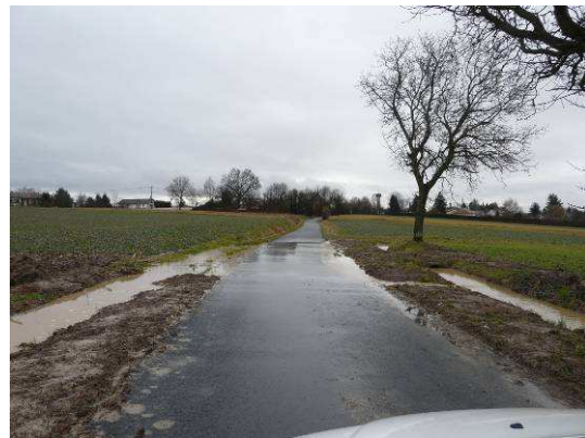
Apport important des drainages sur la plateau